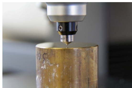
Kugeleindruck bei einer Brinell-Härtemessung.