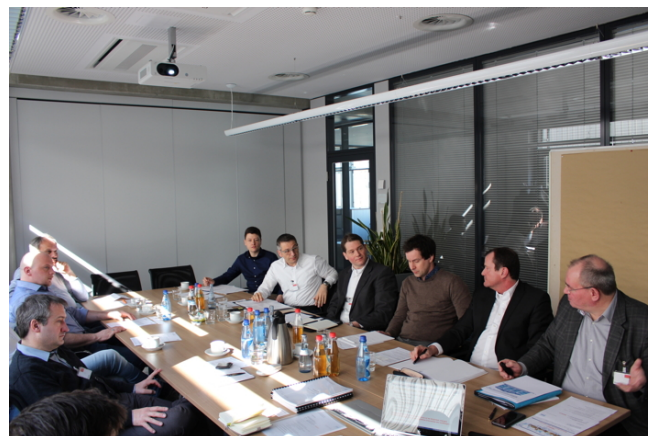
GMS-Workshop im Jahr 2019: Dieses Jahr das Format definitiv Online angeboten – und nach Möglichkeit bald wieder in Präsen.z